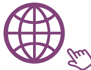
移动互联网 产品与服务