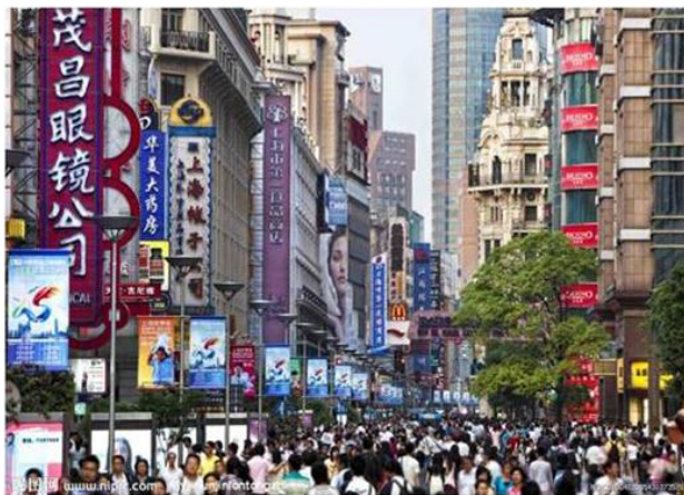
人流最密集的城市生活广场