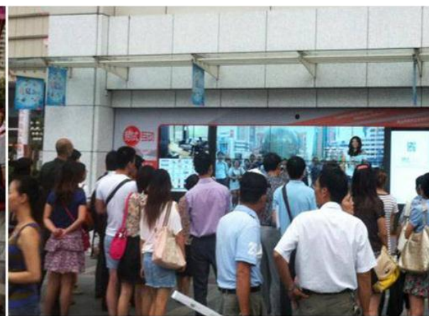
快速进行品牌传播