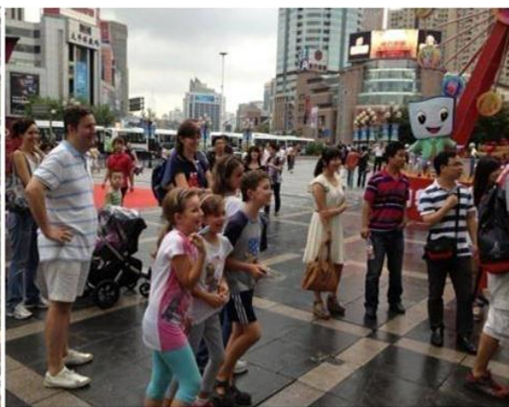
休闲的消费人群参与互动游戏